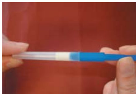
Patuloy na itulak ang pansundol sa pangkolektang tubo hanggang sa magklik ito.

Para sa tulong sa pagkumpleto ng pagsusuri, mangyari lamang na tumawag sa 1300 738 365 (sa halaga ng lokal na tawag) sa pagitan ng 9n.u. at 5n.h. EST Lunes – Biyernes.