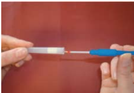
Ставете го стапчето за земање примерок во малото шишенце за примероци.

НЕМОЈТЕ да го вадите стапчето за земање примерок откако сте го ставиле внатре.