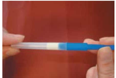
Tiếp tục đẩy que lấy mẫu xét nghiệm vào bên trong ống lấy mẫu xét nghiệm cho đến khi nghe tiếng kêu 'tách'.